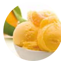
MANDARINO tardivo di Ciaculli