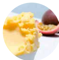
FRUTTO DELLA PASSIONE