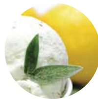
LIMONE E SALVIA