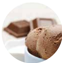
CIOCCOLATO al latte