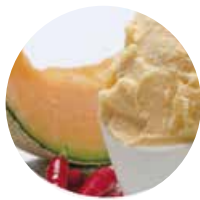
MELONE E PEPERONCINO