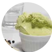
PISTACCHIO GIN E PEPE