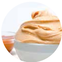
DULCE DE LECHE