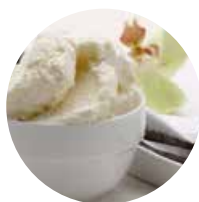
VANIGLIA del Madagascar