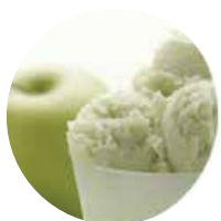
MELA VERDE Granny Smith