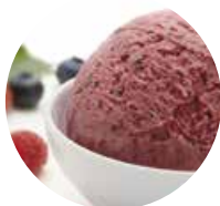
FRUTTI DI BOSCO